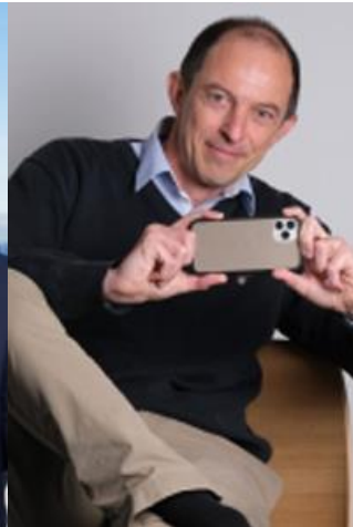
Expert Communication digitale et marketing