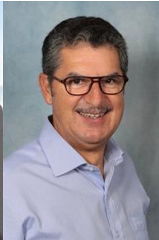
Expert en développement d'affaires