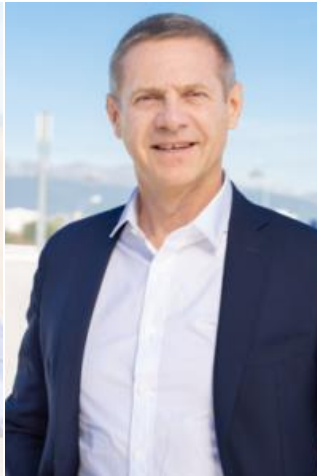
Expert Développement Commercial