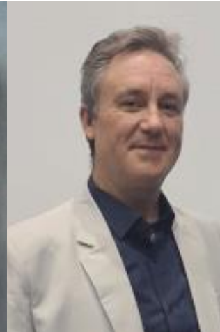
Expert Marketing industrie alimentaire