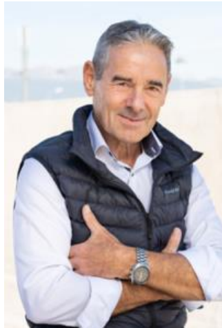
Expert Biens de Grande Consommation

Ils répondront à toutes vos questions Marketing, Vente, Communication, Digitalisation, et Développement en se basant sur leurs expériences .