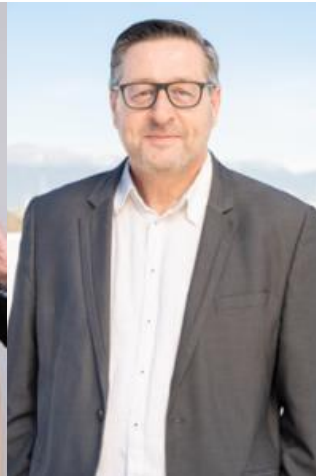
Expert Commerce et Etudes