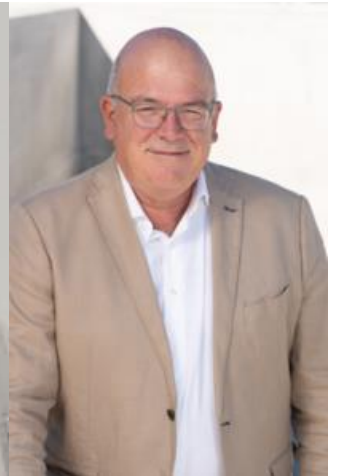
Expert Communication, Web et Digital

Ils vous aiguilleront aussi vers tous les prestataires éprouvés de leur réseau .